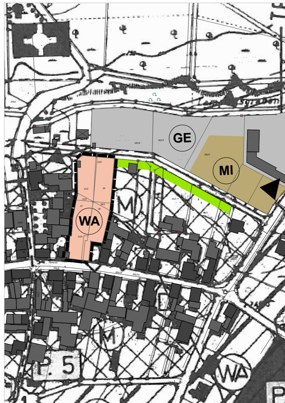
Berichtigte Fassung des FNP (Ausschnitt)