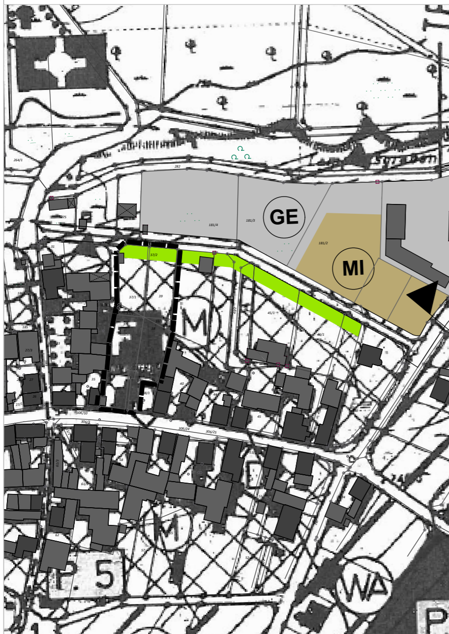
Ausschnitt aus der aktuellen Fassung des FNP des Marktes Mönchberg mit Kennzeichnung des Geltungsbereichs